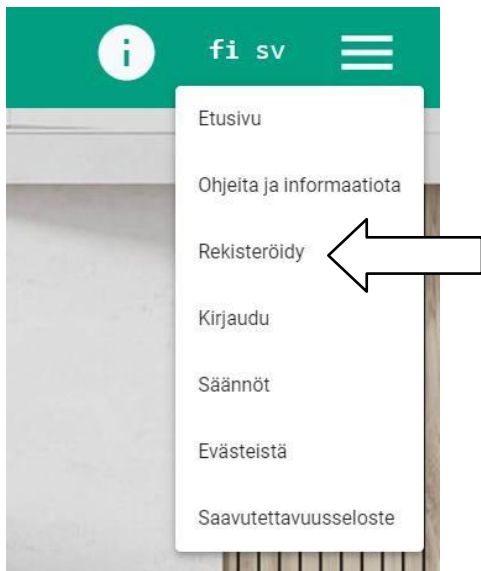
Kuva 1. Etusivun valikko.

Luo käyttäjätunnus menemällä etusivun oikeassa yläkulmassa olevaan valikkoon (katso kuva 1) ja valitsemalla ” rekisteröidy ”. Syötä tarvittavat tiedot ja paina ” tallenna ”. Kirjautut samalla sivustolle ja nimimerkkisi tulee näkyviin etusivun oikeaan yläkulmaan.